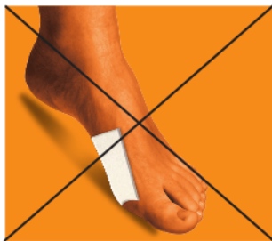
Fig.2: Il feltro non deve coprire la deformità

Fig.1: Apply felt with the round shape around the affected part