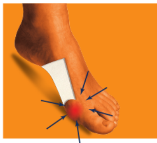
Fig.1: La parte arrotondata deve essere posizionata attorno alla deformità

Fig.1: Apply felt with the round shape around the affected part